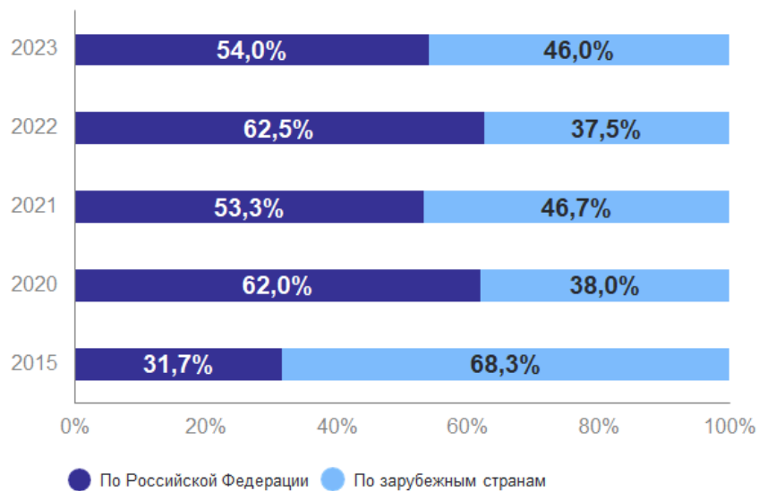
Рис.1. Распределение обслуженных граждан, отправленных в туры по территории России и зарубежным странам в 2015-2023 гг. (в процентах).